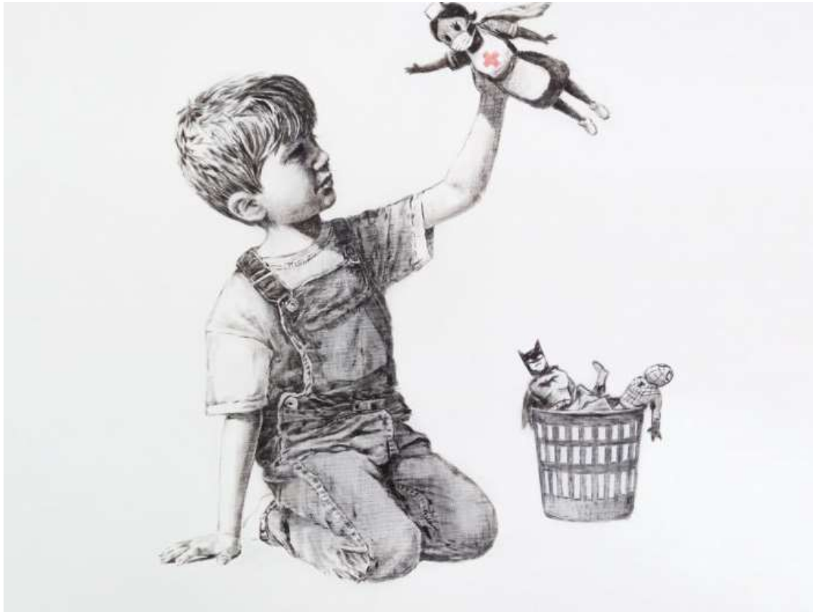
Banksy (2020) – Game changer – Southampton, Ospedale universitario