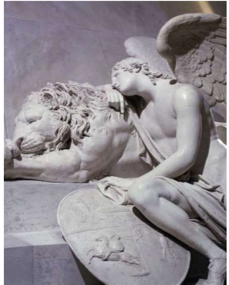
Antonio Canova (1805) – Vienna, Monumento funebre per Maria Cristina d'Austria