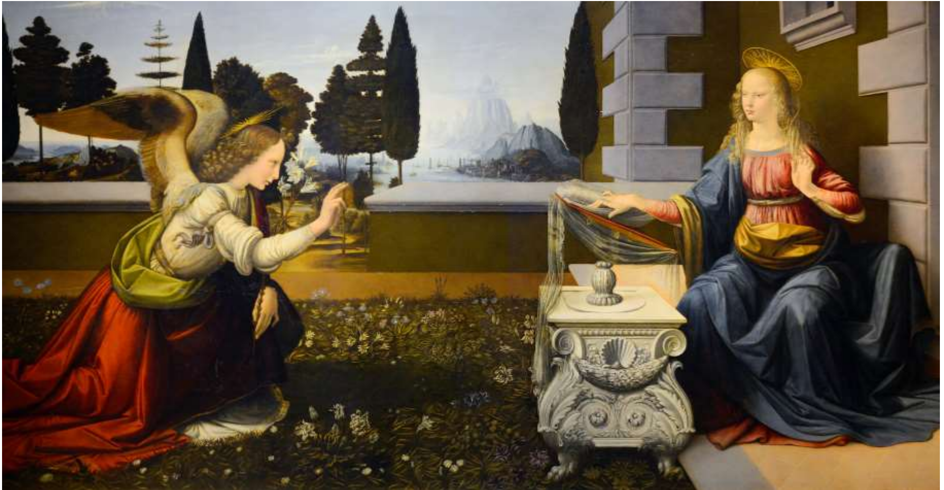
Leonardo da Vinci e Andrea del Verrocchio (1472) – Firenze, Galleria degli Uffizi